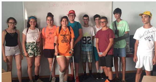
Équipe des jeunes journalistes.

Maintenant, les organisateurs sont en droit de s'interroger sur la question suivante : est-ce que les valeurs qui sont censées se dégager de cet événement se retrouvent concrètement dans la pratique ? Pour répondre à cette question, nos journalistes s'occupent de récolter des informations à la salle centrale et aux différents points stratégiques de l'évènement. Ils sont chargés de nous envoyer toutes les informations qu'ils auront collectées. Nous traitons en salle informatique ces informations, écrivons des articles et mettons en page nos productions, de manière à rédiger un journal cohérent. Ainsi, il nous est possible d'effectuer déjà des comparaisons entre les attentes des organisateurs et ce qui se passe