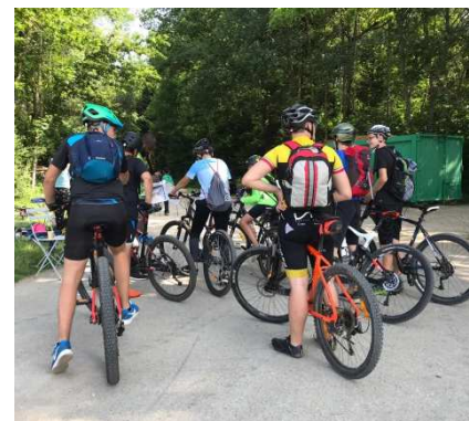
Élèves sur leur VTT.

Voilà donc à propos des 2300 élèves qui pratiquent aujourd'hui principalement, soit la marche, l'athlétisme, la course ou le VTT.