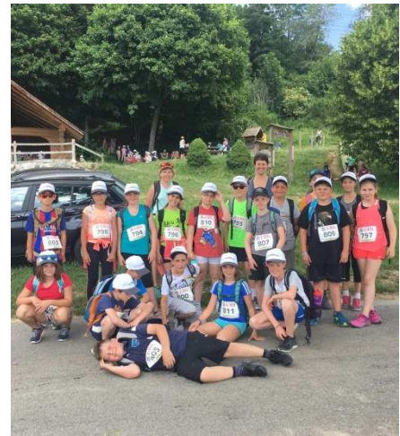
Classe de 6H à la Jonchère.

Les sportifs facilement et les autres moyennement.